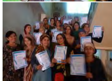
Рисунок 7. Тренинг по основам предпринимательства