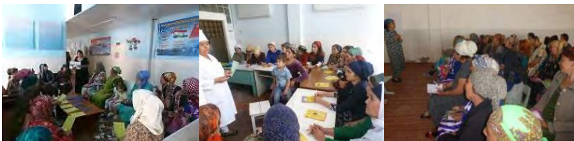
Рисунок 3. Информационные сессии

За отчетный период проведено 7 информационных сессий с участием 151 женщины, вернувшихся из трудовой миграции на тему сексуального и репродуктивного здоровья и планирования семьи. Занятия были проведены приглашенным специалистом Центра репродуктивного здоровья города Курган-тюбе.