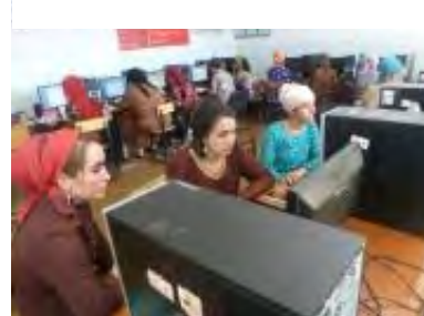
Рисунок 5. Курсы по компьютерной грамотности