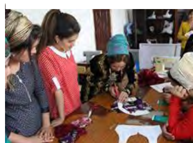
Рисунок 6. Курсы кройки и шитья

Представительства (душ, отдых, просмотр ТВ и т.д.);