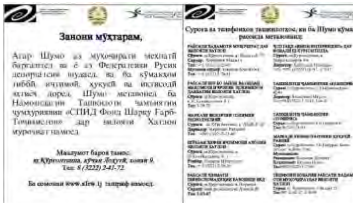
Рисунок 2. Информационный листок проекта

В ноябре 2016 г. был разработан и напечатан информационный листок проекта о службах, предоставляющих медицинские, психологические, образовательные, правовые, социально-экономические и бытовые услуги уязвимым женщинам.