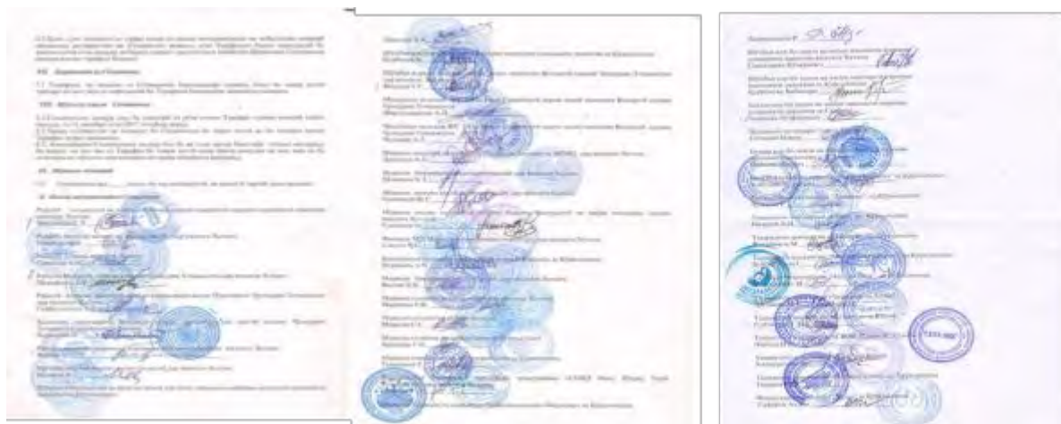
Рисунок 1. Соглашение о сотрудничестве

Из числа 47 организаций участниц-соглашения - 27 партнера являются государственными учреждениями, 2 исправительных учреждения, 16 общественных организаций Хатлонской области, городов Душанбе и Худжанд, а также 2 микрофинансовые организации.