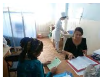
Рисунок 4. Консультация гинеколога